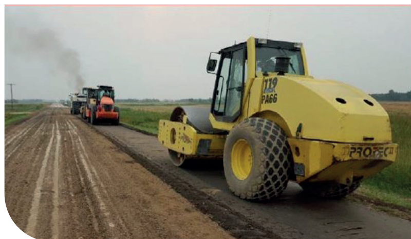
Les travaux de construction, de contrôle, de surveillance et d'entretien courant mécanisé des routes et des pistes rurales avec la solution CLAYLOK.