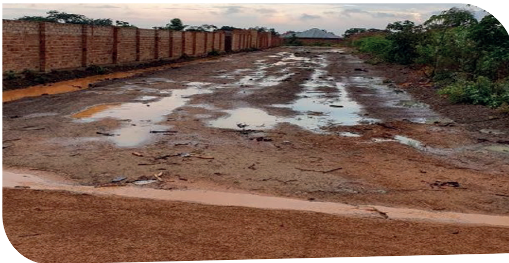
Piste non traitée v/s Piste traitée avec la solution CLAYLOK après pluie : (République Démocratique du Congo).